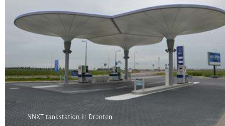
NXT tankstation in Dronten

Vanuit deze ambitie is bij het NXT-station in Westzaan ruimte beschikbaar gemaakt voor uitbreiding met LNG en/of waterstof.. “In Dronten hebben we plannen voor snelladers. Deze locatie ligt op een nieuw bedrijventerrein. Volgend jaar komt er naast deze locatie een horeca gelegenheid. Dat is een must gelet op het feit dat een gemiddelde laadbeurt zo’n 20 tot 30 minuten duurt. Dan is horeca in de buurt wel erg prettig.”